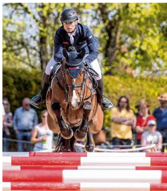
Dritte und letzte Disziplin der Vielseitigkeitsprüfung ist das Parcoursspringen, das nochmals für Nervenkitzel sorgt.