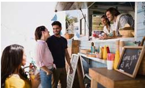
Food Trucks und Livemusik