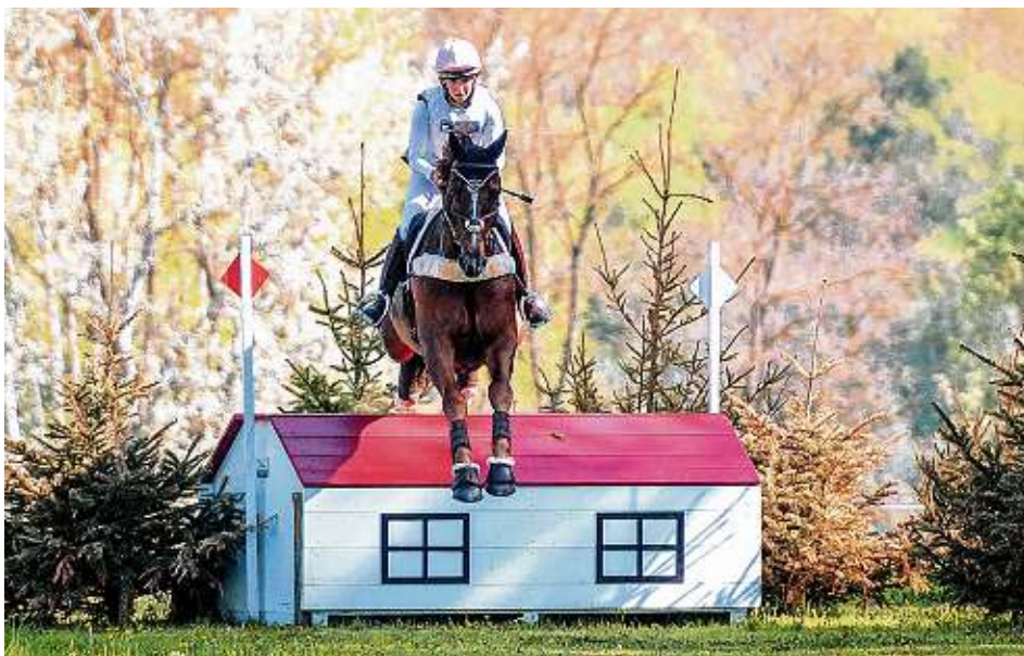
Zweiter Teil ist die Geländeprüfung. Hier muss die „Laufrichtung“ stimmen, rechts die rote und links die weiße Fahne.