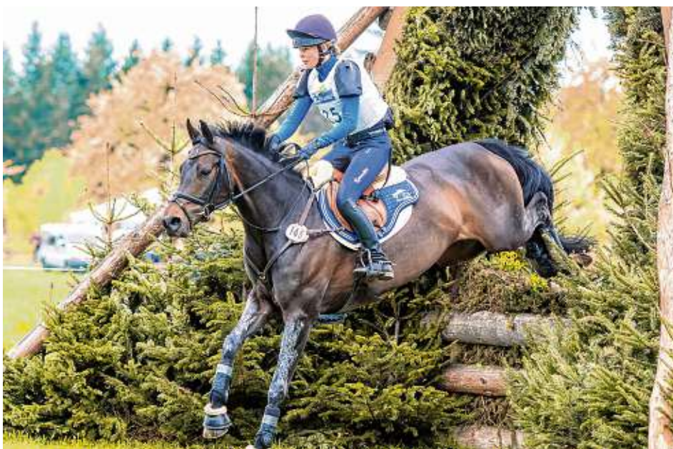
Ein besonderes Hindernis ist das mit Zweigen gestopfte Eulenloch.

Die Anforderungen an Pferd und Reiter sind hoch. Die Spannung für die Zuschauer garantiert.