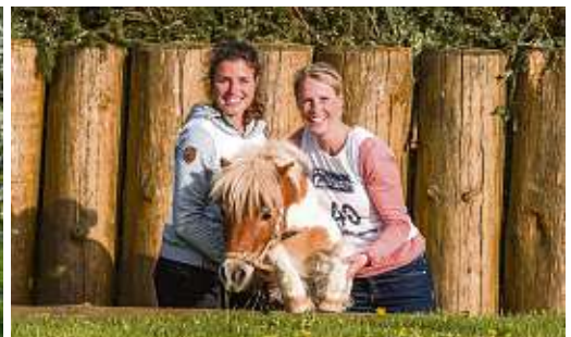
Programm für Jung und Alt