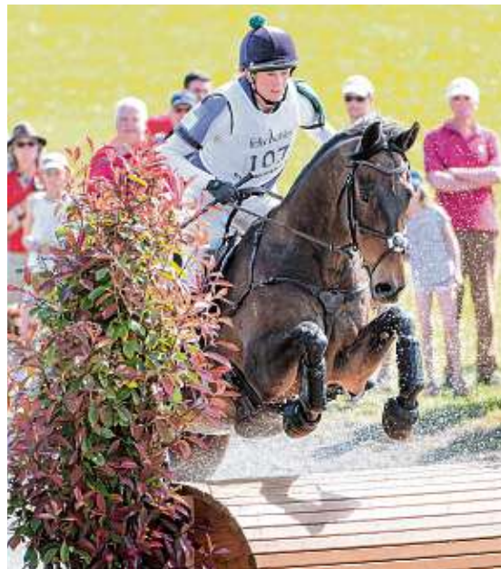
Spektakulär sind die Wasserhindernisse. Die Zuschauer sind hautnah dabei.

Für viele Reiter sind die Olympischen Sommerspiele der höchste Sieg, den sie erreichen können. Seit 1912 gehört Vielseitigkeitsreiten dazu. Seit 1990 treten die Sportler immer zwei Jahre nach den Olympischen Sommerspielen zu den Weltreiterspielen an. In Europa gibt es seit 1953 die Europameisterschaften im Vielseitigkeitsreiten. Sie werden seit 1965 alle zwei Jahre, in den ungeraden Jahren, ausgetragen.