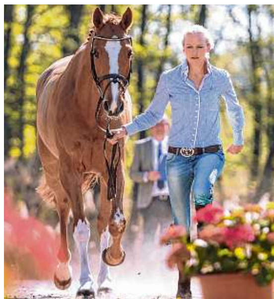
Nach dem Gelände folgt die Verfassungsprüfung, dann geht es zum Parcoursspringen.