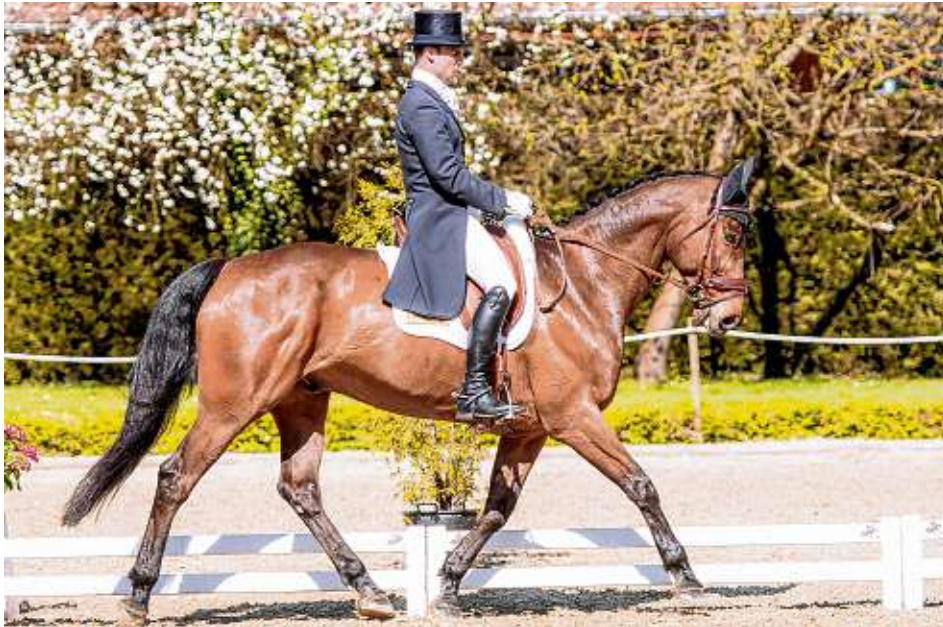
Die Dressur steht am Beginn der Vielseitigkeitsprüfung und eröffnet das Turnier auf dem Weiherhof am Freitag, 19. April.